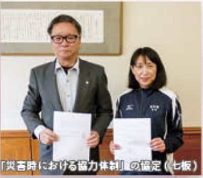
「災害時における協力体制」の協定(七坂)